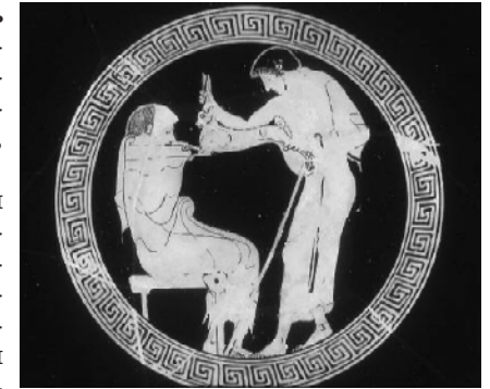
Мужчина, соблазняющий мальчика. Древнегреческая керамика, VI в. до н. э.

Среди проститутирующих наблюдается спектр невенерических заболеваний, передающихся половым путем, причём уровень этих заболе-