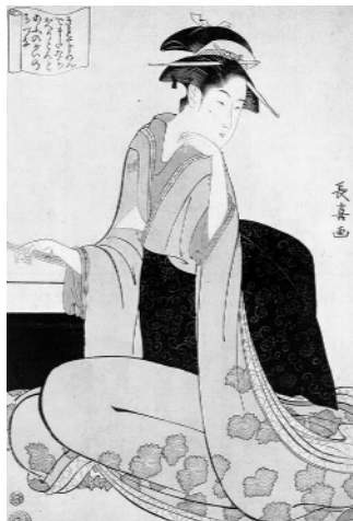
Гейша (1794). Эйхосай Чоки (1780—1800)

лено, что 74% проституировавших студенток имели чрезвычайно широкий диапазон сексуальной приемлемости, т. е. комплекс отклонённых сексуальных потребностей, в большинстве случаев воплощённых в реальной жизни. Из отклонённых форм сексуального поведения проституировавших выделяются: