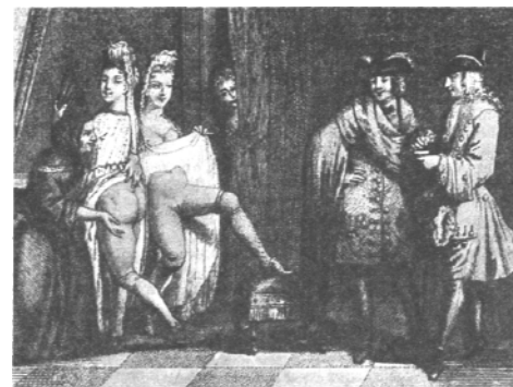
Бордель. Гравюра неизвестного художника XVII в.

3. Комплекс отклоненных сексуальных потребностей. Психоматериальный и защитный факторы в прости-туции не являются основными – их следует рассматривать в сочетании с комплексом отклоненных и извращенных сексуальных потребностей, который также лишь инициирует прости-туирование. Так, нашими исследованиями установ-