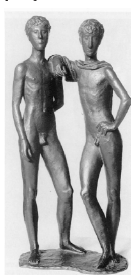
Друзья (1934). Marx, Gerhard

В группе школьников из пролетарской среды выявился достоверно более ранний возраст начала табакокурения – в 11 лет, чем в группе школьников, стремящихся к получению высшего образования (13 лет). Аналогичная картина наблюдается и относительно возраста начала употребления алкоголя – в 12 и в 16,5 лет, соответственно.