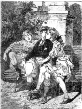
На скамейке. Martin Van Maele (1907)

внешне выглядят значительно младше своего календарного возраста. Так, из обследованных нами школьников – учащихся периферийных школ, ойгархе отсутствовало у четверти (!) юношей, достигших 16–17-летнего возраста. Это связывается с низким качеством жизни в целом и питания, в частности. Средний возраст появления менархе в настоящее время у русских девушек составляет 12,8 лет; ойгархе у русских юношей из благополучной среды – 13,6 лет, у остальных – 14,1 лет.