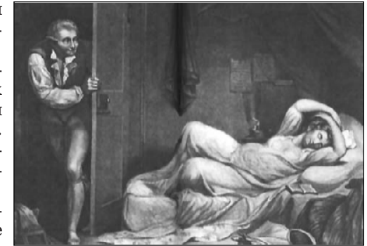
Распутная дочь (1796). Норткот Джеймс (1736–1841)

При другом анонимном опросе, проведённом среди студентов колледжей США, 5% сообщили о каких-либо добровольных сексуальных опытах в детстве и в подростковом возрасте с братом или сестрой. Как правило, негативное влияние таких добровольных детских опытов отсутствовало.