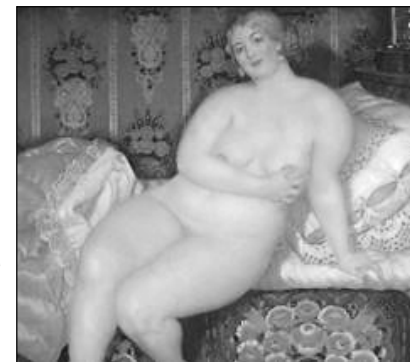
Красавица. Б.М. Кустодиев

К концу 20-х, к началу 30-х годов социальный состав проституирующих изменился, среди них гораздо больше стало деревенских девушек, покинувших разоренные села, вынужденно втянутых в городскую жизнь коренными социально-экономическими преобразованиями.