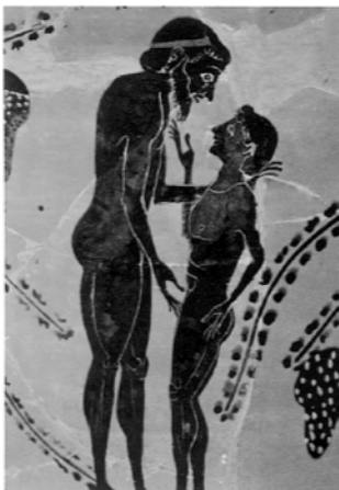
Влюбленные. Греческая краснофигурная керамическая роспись (ок. 520–490 гг. до н. э.). Неаполь

Специалисты объясняют эту форму полового поведения следующими факторами: