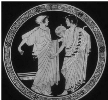
Гетера и юноша (480–470 гг. до н. э.). Древнегреческая керамика. Музей Дж. Пола Гетти (Лос-Анжелес)

Во все времена и у всех народов любовь, в том числе и мужская, подростковая продавалась за деньги или за подарки (на античных чашах подарки символизируют сумки, петухи, зайцы), и так будет всегда. Еще Гомер рассказывал об интенсивной торговле мальчиками, которых привозили финикийские мореплаватели, чаще всего, похищая их, чтобы заполнить гаремы по берегам Средиземноморья.