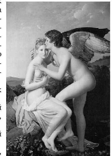
Первый поцелуй Амура и Психеи (1789). Франсуа Жерар Давид (1770–1837). Лувер

0,6% школьниц из пролетарской среды проституировали с 14-летнего возраста. 0,5% мальчиков из этой же среды занима-