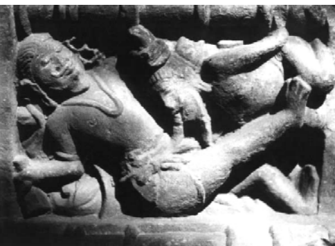
Auparashtika. Temple of Chhapri, Central India, 12-th century CE

Если "условно нормальные" женщины относятся к конкордантным личностям, то в профиле проституировавших обнаружены пики по шкалам F, 4, 7, 8, 9, сближающие их с профилем "provokatorov" сексуального насилия – жертв покушений на изнасилование. Такой тип профиля относится к пограничному, отражает смешанный, внутренне противоречивый тип реагирования, в котором сталкиваются разнонаправленные тенденции: склонность к активности и решитель-