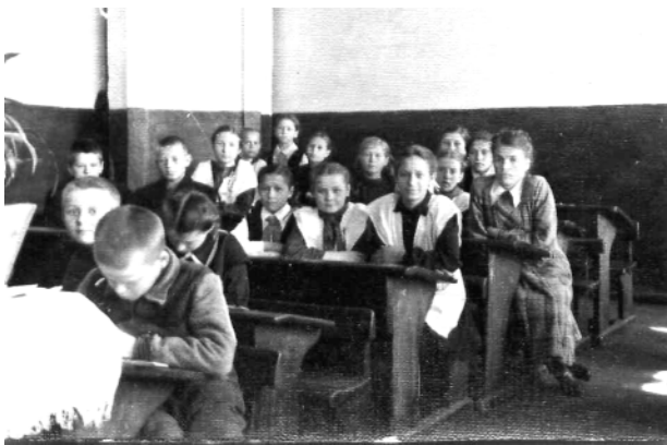
Сельская школа середины XX в.

правовые последствия. В последнее время, впрочем, как и прежде, педагоги, имея печальный опыт так называемого "полового просвещения" "перестроечного" и "постперестроечного" времени (с раздачей школьникам презервативов и пр.), весьма настороженно относятся к всякого рода попыткам просветитель-