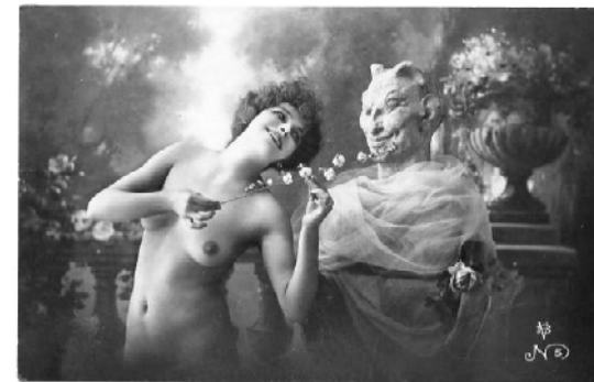
Девушка с изваянием Пана. XIX в.

Есть, конечно, и "случайные" проститутки, проституировавшие по внешне непонятным причинам, нередко лица с пограничной или явной психической патологией.