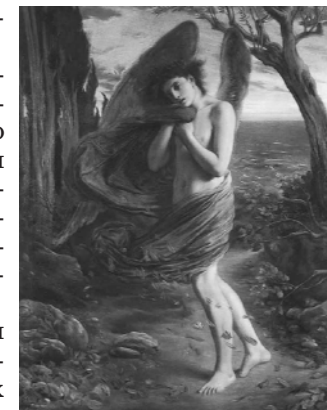
Любовь в непогоду (1866). Simeon Solomon

9) диапазон сексуальной приемлемости (следовательно, и уровня сексуальной девиантности) расширяется с повышением возраста;