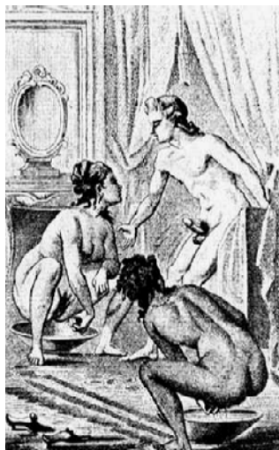
В борделе. Гравюра неизвестного художника XVII в.

ваний у них значительно выше, по сравнению с четырьмя классическими венерическими болезнями. Так, в постсоветской Латвии распространённость гонореи, сифилиса, бактериальных vaginosis, trichomoniasis и ectoparasites обнаруживалась соответственно в 10,2%, 15,7%, 68,2%, 35,5%, 15,9%; отказ от использования презервативов является общим правилом. Десятая часть простиитуирующих использует наркотики.